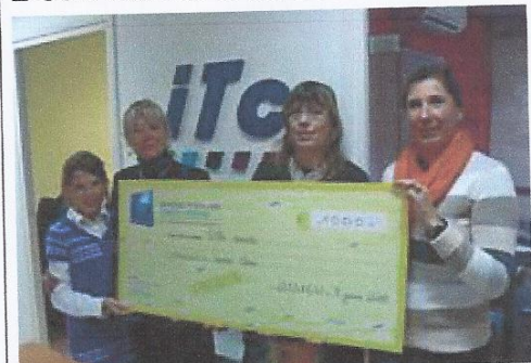
■ La société International traduction conseil a souhaité participer, par le biais de cette association, au bien-être des enfants malades.

La société International traduction conseil (ITC), qui a son siège dans le domaine du Bois-Dieu, a eu le plaisir de remettre, lundi, à l'association Docteur Clown un chèque de soutien d'un montant de 1 000 euros. « La société a décidé, cette année, d'envoyer ses vœux par e-mail et de reverser le budget alloué habituellement à la création de cartes de vœux à une association s'occupant du bien-être des