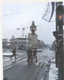
■ Place de l'Horloge, hier matin.